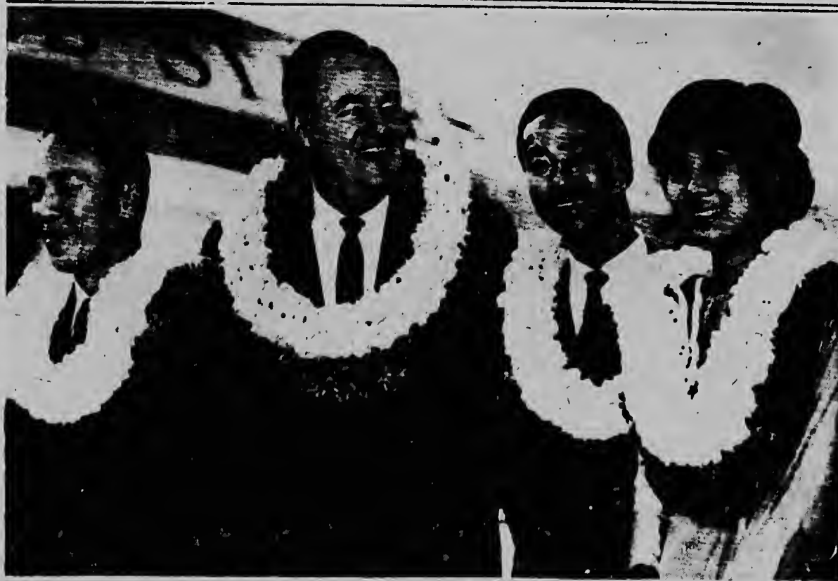
HONOLULU -- Vice-presidente Hubert Humphrey y alto lidernan vietnames ta sali pa Saigon, pa trata riba paz. Di robes pa drechi: hefe di estado vietnames, Nguyen Van Thieu, Humphrey, promer minister vietnames Nguyen Ky y señora Ky.

E sentido di insatisfaccion aki lo no ser eliminá awor cu Vaticano a anuncia qu nan lo declara Papa Pio XII como santu; al contrario, hasta den prensa catolico nan ta considera e anuncio aki cu poco escepticismo.